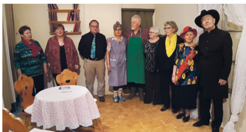
Theatergruppe Uttigwälle

Pfrn. Ruth Steinmann und der Frauenverein Kiesen/Oppligen