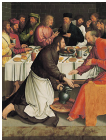
Bernhard Strigel 1460–1521, Deutschland