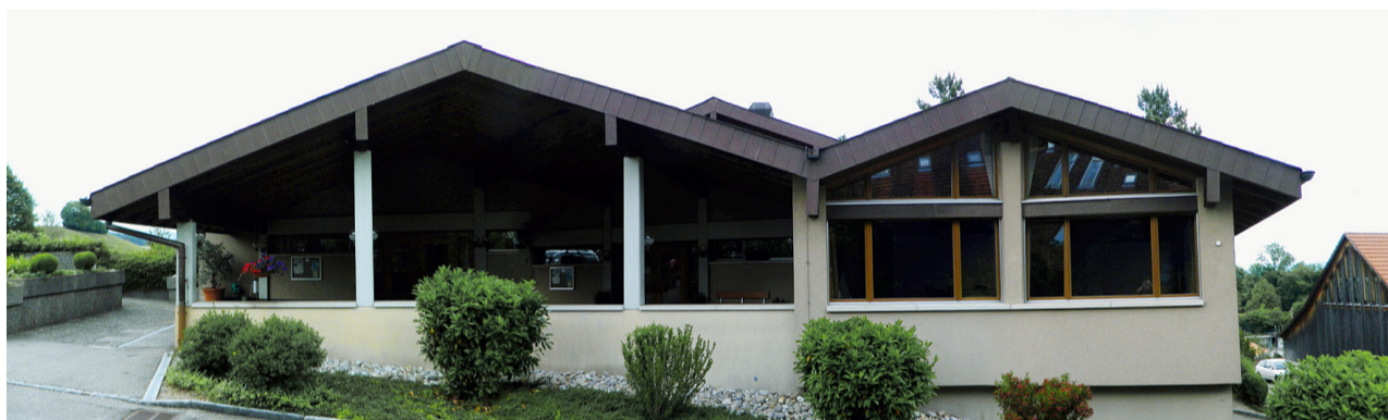
Südseite des Kirchgemeindehauses Uttigen