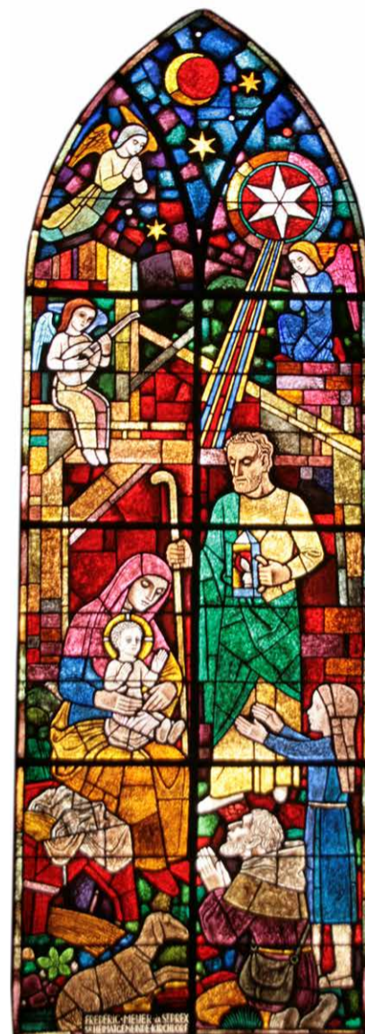
Weihnachtsfenster der Kirche Kirchdorf

Als das Licht der Engel die Hirten umstrahlt und sie den Zuspruch